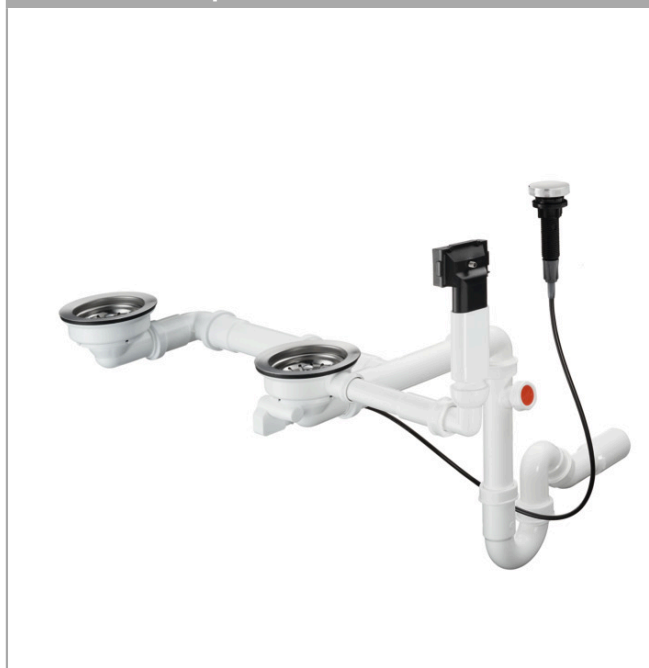
Ilustración del producto