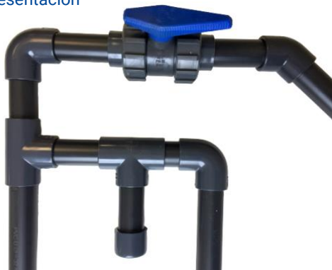
Ejemplo de uso