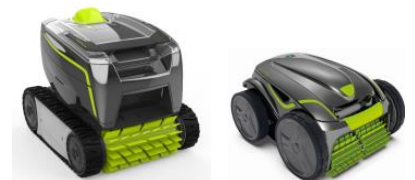
Robot Robot GT3220/GV3420