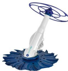
Limpiafondos automático Automatic cleaner 90397