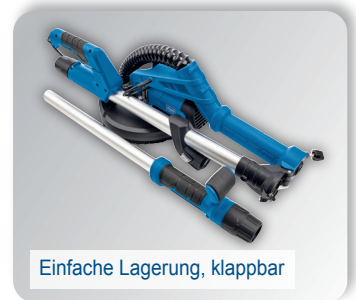
Einfache Lagerung, klappbar