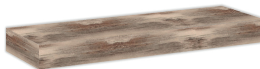
* Acabado Bora-Bora