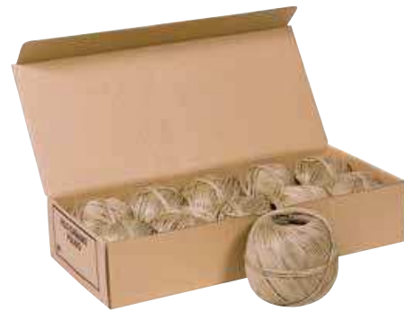
Presentación en ovillo caja 10 unidades Presentation on ball box of 10 units