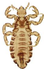
Piojos ( rhhipicephalus sanguineus )

Consejos: Utilizar el COLLAR REPELENTE DE INSECTOS PARA PERROS PET&GARDEN . Mantener limpio el entorno de nuestra mascota y desinfectado con el INSECTICIDA DE ENTORNO ANIMALES .