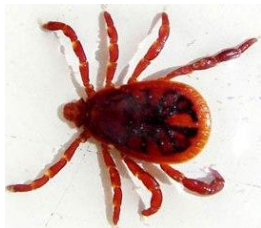
Garrapatas ( rhhipicephalus sanguineus )

Información: Las garrapatas son arácnidos caracterizados por un gran dimorfismo sexual que se alimentan de sangre al quedar enganchadas a la piel. La gravedad de la enfermedad radica, además de la posible aparición de anemia en infestaciones masivas, en la posible transmisión de otras enfermedades como la babesiosis. Ambos parásitos pueden afectar al hombre con especial atención a las picaduras de garrapata que pueden llegar a ser muy graves.