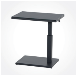
Lifttisch Toreno, 60 x 40 cm, anthrazit, Art.-Nr.: L18934