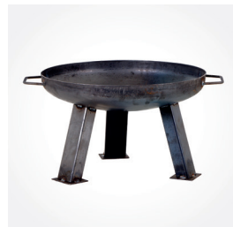
Feuerschale XXL, Art.-Nr.: 378806