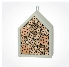
Bienenhaus Solin, Art.-Nr.: M84339