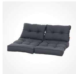
Palettenkissen Almaaz, Dessin Uni grau, Art.-Nr.: J57681