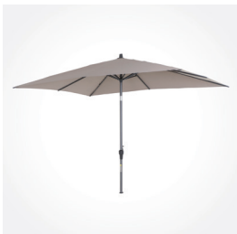
Schirm Avio, 300 x 200 cm, taupe, Art.-Nr.: J31216