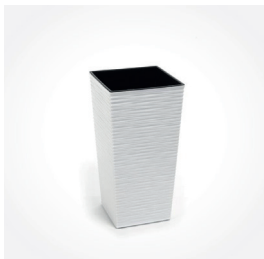
Pflanzengefäß Nizza, weiß, Art.-Nr.: K07029