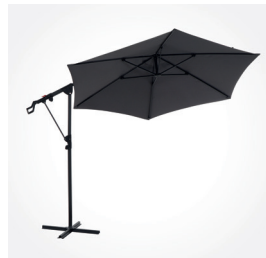
Ampelschirm LEO N°, Ø 300 cm, Art.-Nr.: M32087