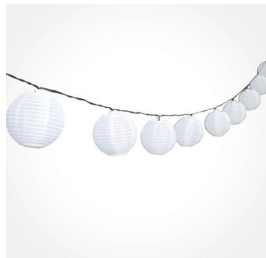
Solar-Lichterkette, 10er, Art.-Nr.: 682241