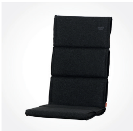
Auflage STELLA, anthrazit, 120 cm, Art.-Nr.: J57632