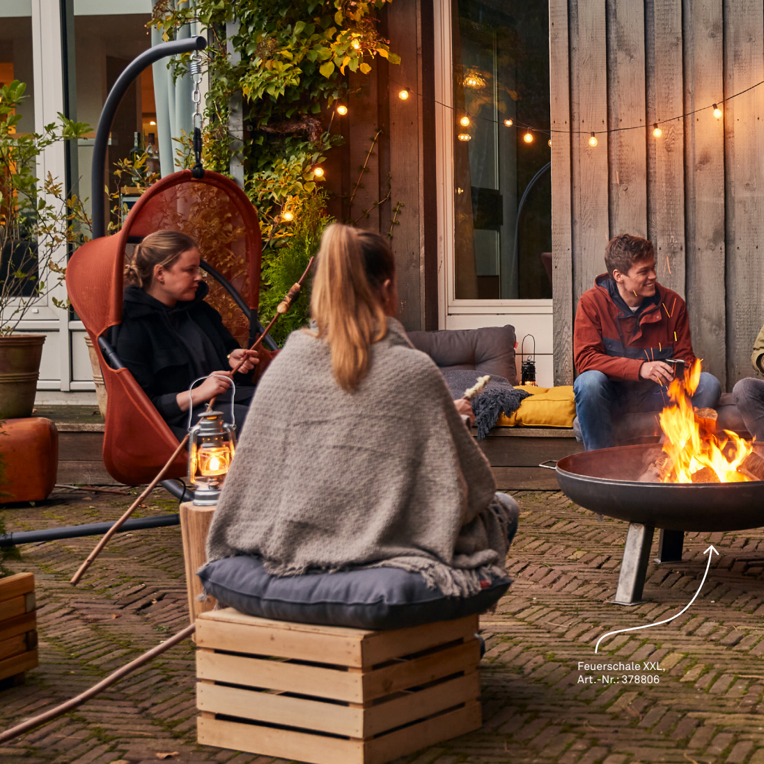
Feuerschale XXL, Art.-Nr. 378806