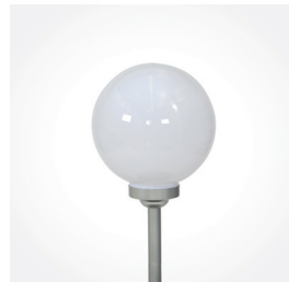
Solar-Leuchtkugel, \varnothing 30 x 66,5 cm, Art.-Nr.: 681981