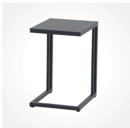
Beistelltisch Ramo, 36 x 43 x 50 cm, Art.-Nr.: H16697