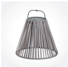
Solarleuchte Henja, anthrazit / beige grau, Art.-Nr.: L18973