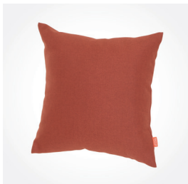
Dekokissen PRIME, terrakotta, Art.-Nr.: L53590