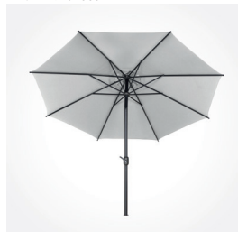
Schirm Isa, Ø 300 cm, Art.-Nr.: M32093