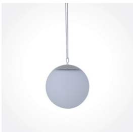
Solarhängekugel, 20 cm, Art.-Nr.: L92654