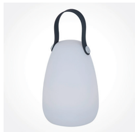
Solartischlampe, 27 cm, Art.-Nr.: L92653