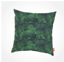
Solarhängekugel, 20 cm, Art.-Nr.: L92654