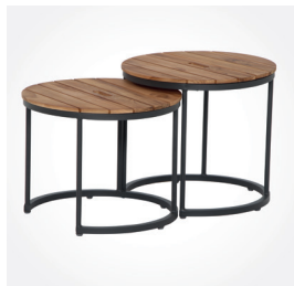
Beistelltisch Set Baros, Art.-Nr.: H16597