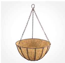
Hängeampel Classic, 35 cm, Art.-Nr.: J58082