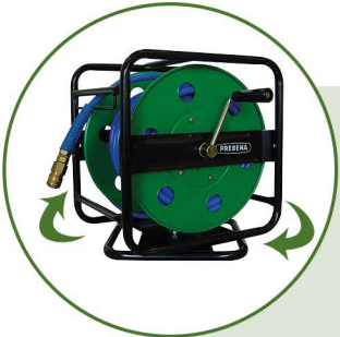
Robustes Metallgestell 360° drehbar