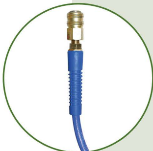
Drehbare Kupplung und Stecknippel