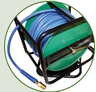
30 m Polyurethanschlauch 8 x 12 mm