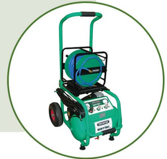
Einfache Montage an WARRIOR Kompressoren

Für die Druckluftversorgung auf der Baustelle und in der Werkstatt