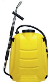
MOCHILA DE EXTINCIÓN

Intervención inmediata en incendios medianos. Permite la aproximación al fuego y construir una barrera protectora.