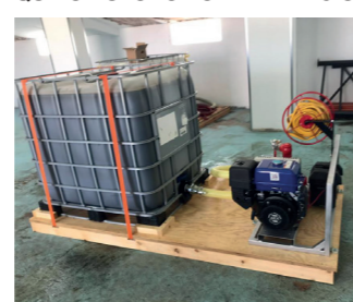
EQUIPO AUTÓNOMO DE EXTINCIÓN

Intervención en grandes incendios. Necesita colocar una motobomba al depósito.