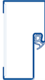
Blockzarge für den Einbau in der Öffnung