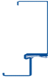
Eck- und Ergänzungszarge