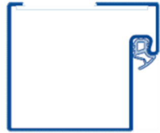
Blockzarge für den Einbau auf der Wand

Die vorstehenden Informationen, insbesondere Angaben und Darstellungen, sind unverbindlich und stellen keine Beschaffenheitsvereinbarung und keine Garantie dar. Änderungen und Irrtümer ausdrücklich vorbehalten. Das Datenblatt ist urheberrechtlich geschützt. Nachdruck, auch auszugsweise, nur mit unserer Genehmigung.