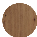
KORPUS Artisan Eiche Nachbildung

Metalleiste zur Verschraubung der Arbeitsplatte