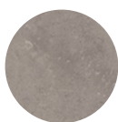
ARBEITSPLATTE Beton Optik