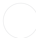
FRONT Weiß Hochglanz