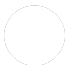
KORPUS Weiß Matt

Metallleiste zur Verschraubung der Arbeitsplatte