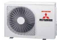
SRC20, 25, 35ZS-W