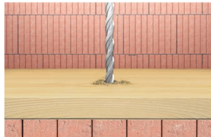
Taladros a través de diferentes materiales