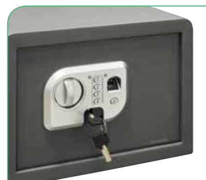
Dispone de llave de emergencia