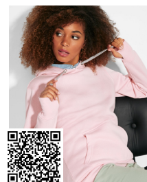
URBAN WOMAN SU1068