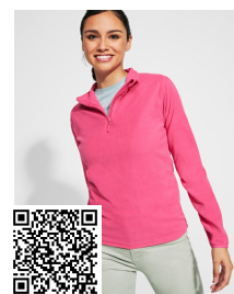
HIMALAYA WOMAN SM1096