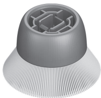
1 600 A02 3KW