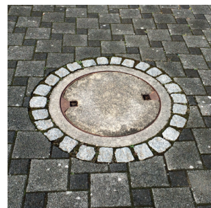
Beispiele für herkömmliche Standardschachtabdeckungen