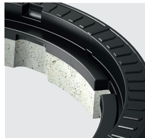
Rahmen aus Kunststoff/Beton