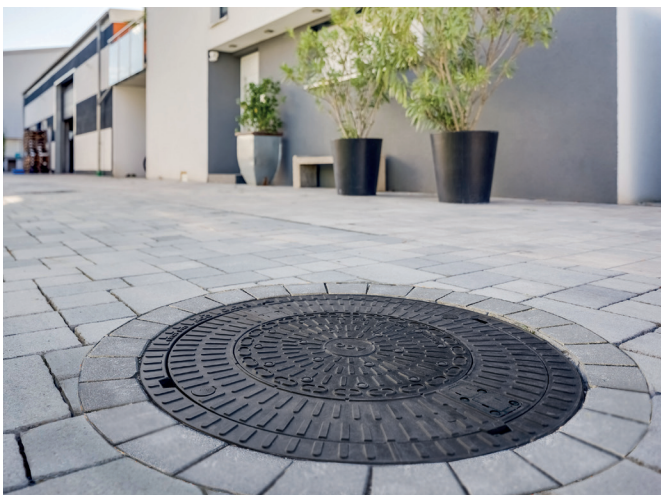
ACO Schachtabdeckung SAKU B 125