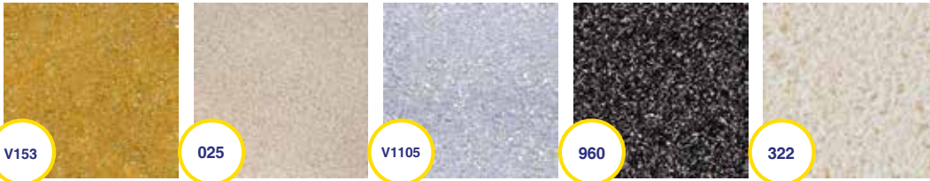
Color and texture of images may slightly differ from the finished coating