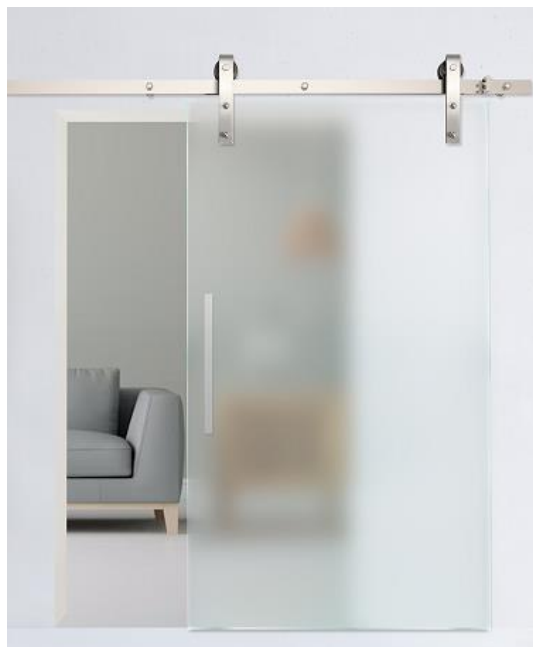
PUERTA MODELO HIRO con herraje visto MGF030-V

Puertas de vidrio para decoración interior del hogar separando de forma suave los diferentes ambientes que nos podemos encontrar dentro del mismo.