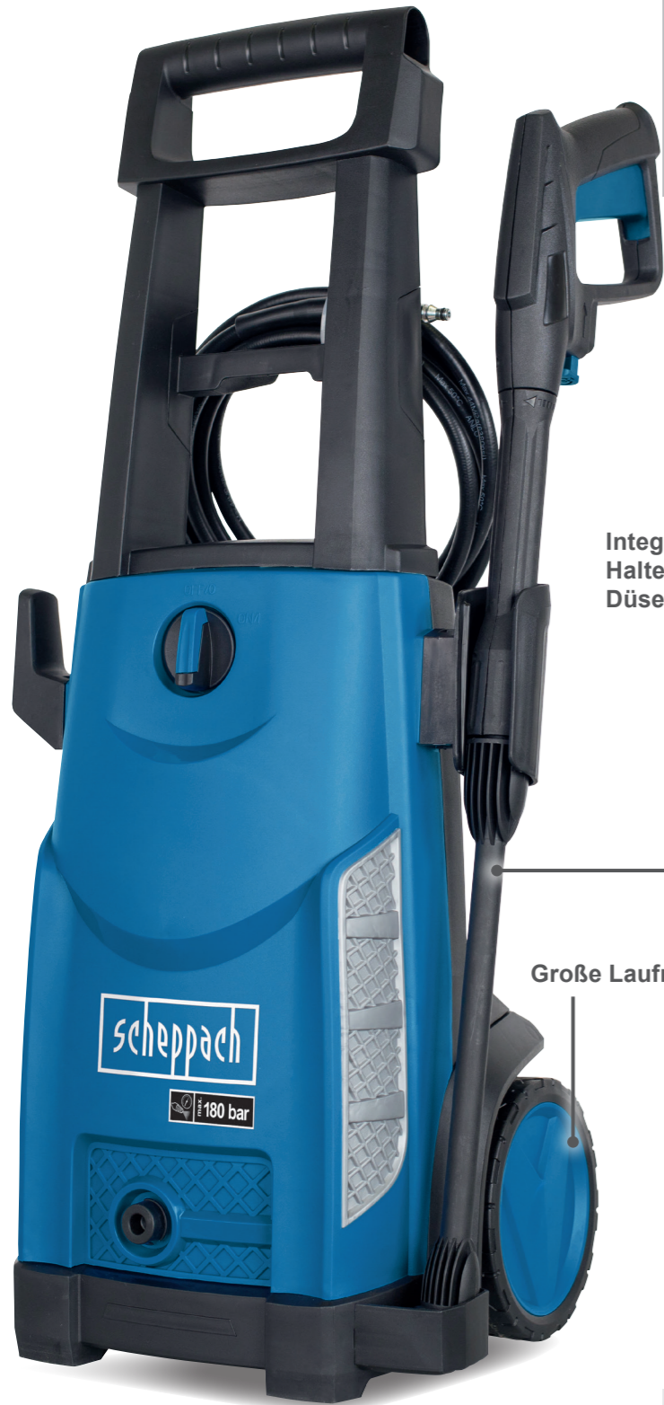
Integrierte Halterung für Düsenaufsätze