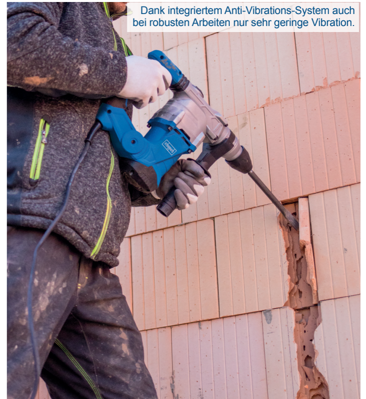
Dank integriertem Anti-Vibrations-System auch bei robusten Arbeiten nur sehr geringe Vibration.