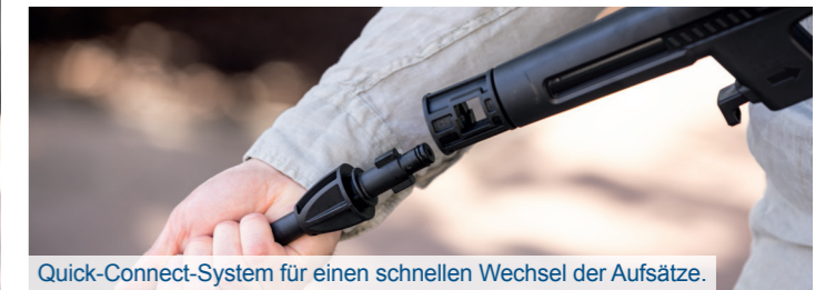
Quick-Connect-System für einen schnellen Wechsel der Aufsätze.