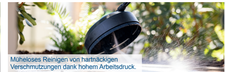
Müheloses Reinigen von hartnäckigen Verschmutzungen dank hohem Arbeitsdruck.