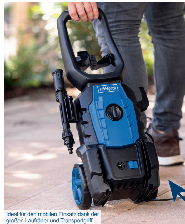
Ideal für den mobilen Einsatz dank der großen Laufräder und Transportgriff.