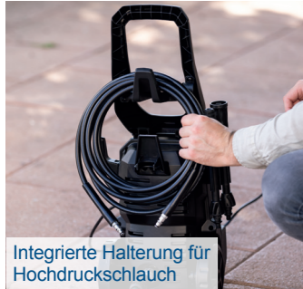
Integrierte Halterung für Hochdruckschlauch

Aluminiumpumpe für extra lange Lebensdauer - langlebig