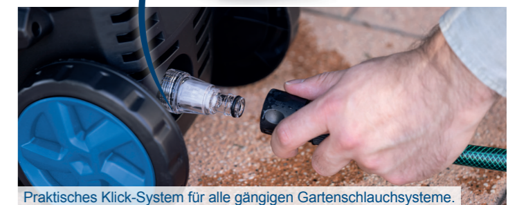
Praktisches Klick-System für alle gängigen Gartenschlauchsysteme.

Integrierte Halterung für Reinigungslanze und Aufsätze