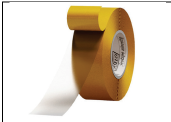
Abb. 1: ICUTEC Icutape einseitig