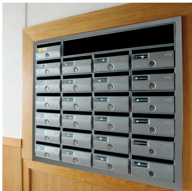
Buzones H3404P empotrados en pared con tapajuntas de aluminio.