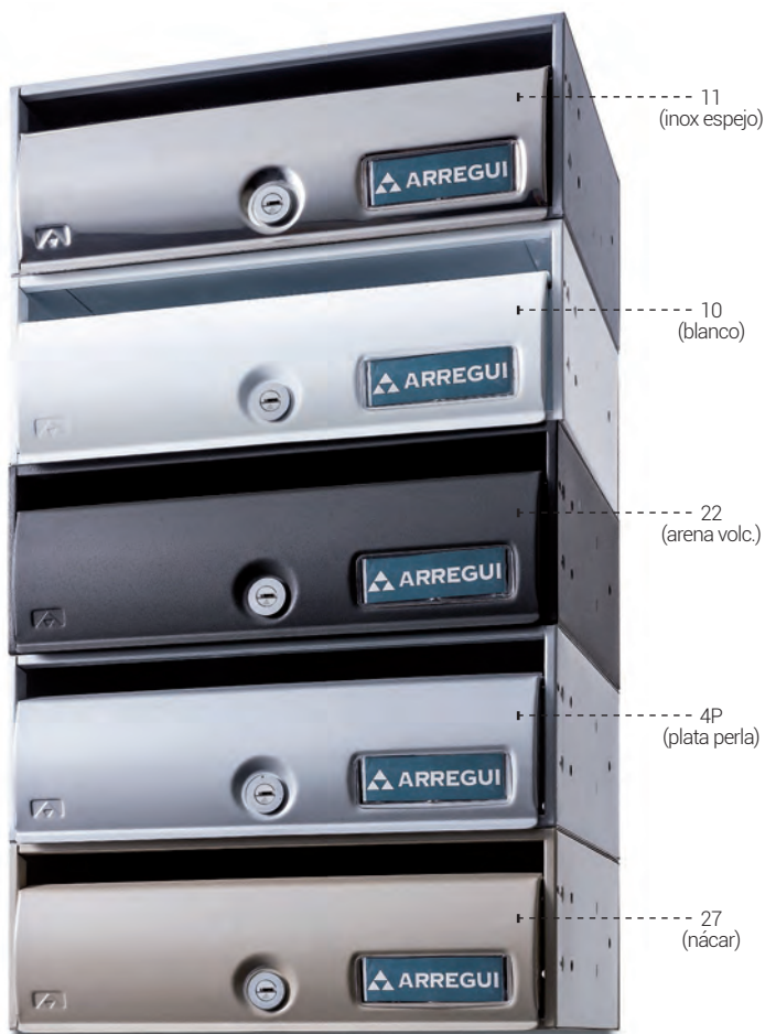
H3500 - Capacidad para documentos A5.