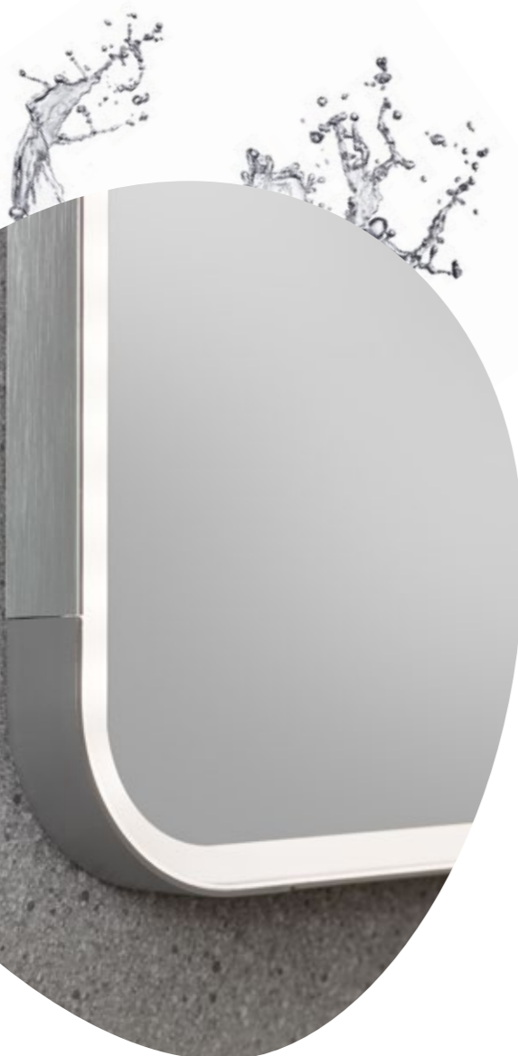
Abgerundete Ecken aus silberfarbenem Kunststoff