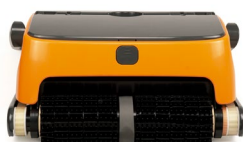
INDICADOR LED Indicador nivel batería