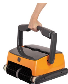
LIGERO Facilita su traslado y manejo