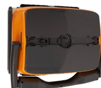
LIMPIEZA Limpia suelo, paredes y línea