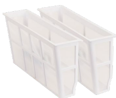
FILTRACIÓN Cestas filtrantes de gran tamaño