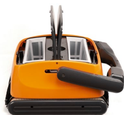
ACCESO Fácil acceso superior