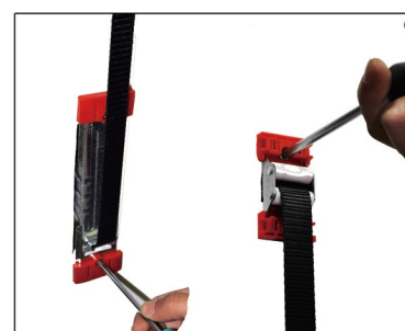
Instalar piezas de fijación y cinta comodamente.