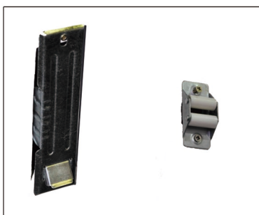
Quitar cinta y embellecedores.