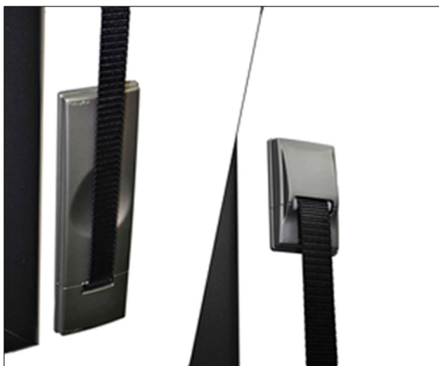
Presionar hacia la pared hasta comprimir ligeramente la espuma en la pared.