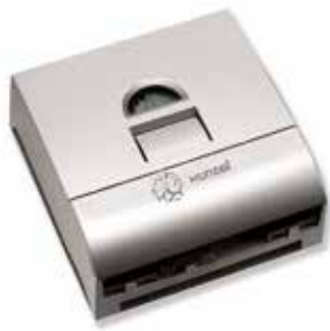
iSCC-XN™ Series - XUNZEL