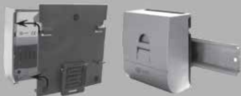
Adaptador de DIN Rail iSCC-DIN™ de XUNZEL (OPCIONAL)