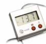
Display digital remoto iSCC-DX™ de XUNZEL (OPCIONAL)