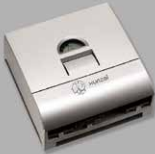
Controlador de carga y descarga solar iSCC-XN™ Series de XUNZEL