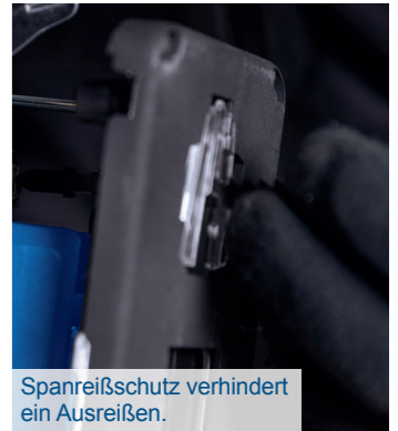
Spanreißschutz verhindert ein Ausreißen.