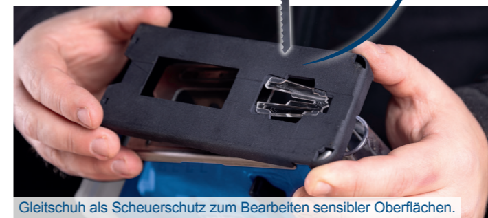
Gleitschuh als Scheuerschutz zum Bearbeiten sensibler Oberflächen.