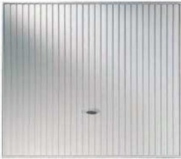
Novoferm Alsal CLASSICA En acero, acanalada vertical. RAL 9018 Blanco