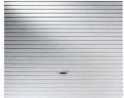
Novoferm Alsal ELEGANTE En acero acanalada horizontal.