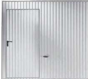
Novoferm Alsal PRACTICA En acero, acanalada vertical con puerta peatonal incorporada.