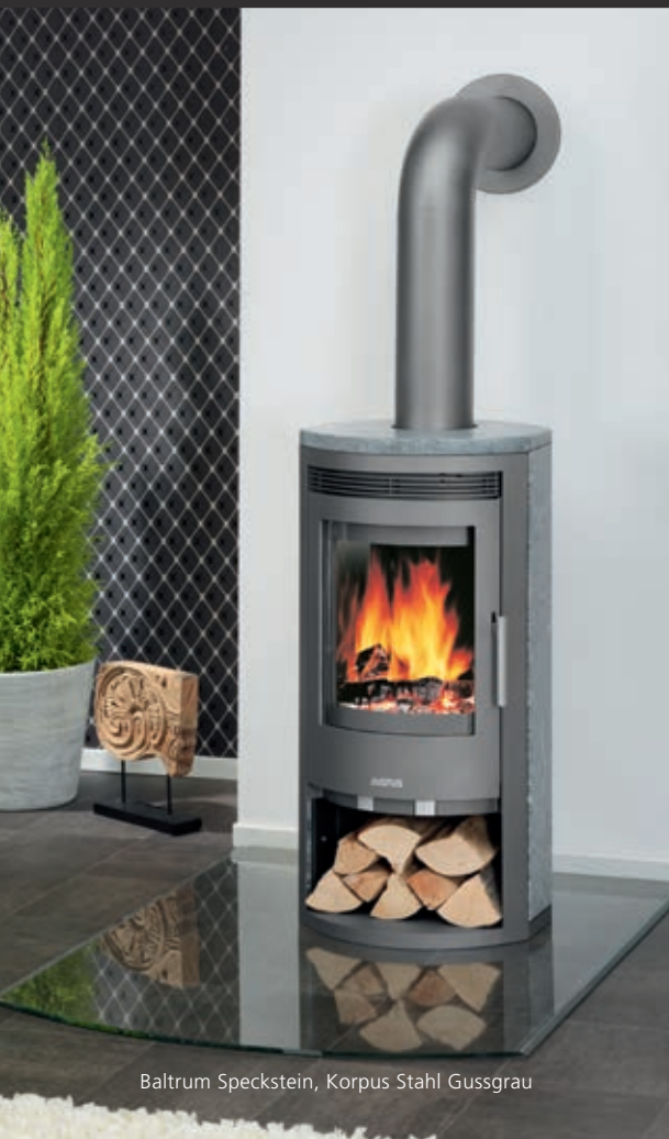
Baltrum Speckstein, Korpus Stahl Gussgrau

Den Kaminanschluss und den Aufstellort müssen Sie grundsätzlich immer mit dem zuständigen Schornsteinfeger abstimmen. Die erforderlichen Sicherheitsabstände sowie die zur Schornsteinberechnung erforderlichen Verbrennungsdaten entnehmen Sie der Bedienungsanleitung. Richten Sie dabei Ihr besonderes Augenmerk auf den Kaminzug (Förderdruck). Schließlich dient der Schornstein als Motor der Feuerungsanlage. Eine Abweichung des Förderdrucks um +/- 25 Prozent des in der Bedienungsanleitung genannten Nennwerts ist dabei erlaubt.