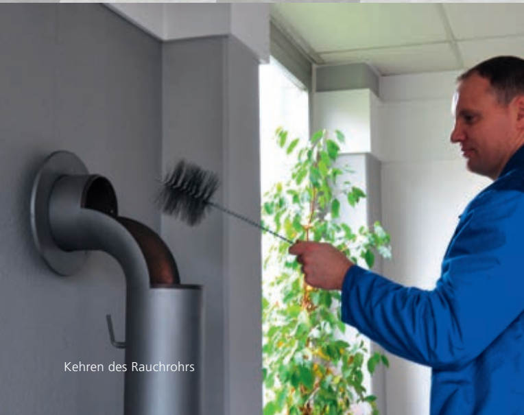
Kehren des Rauchrohrs

Über ein Einstellrad kann der Förderdruck auf den gewünschten Wert begrenzt werden. Die Installation erfolgt im so genannten Raumlufverbund.