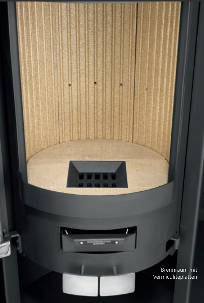
Brennraum mit Vermiculiteplatten