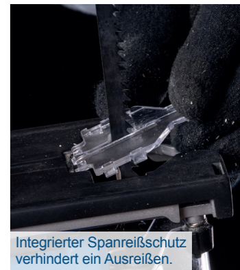
Integrierter Spanreißschutz verhindert ein Ausreißen.