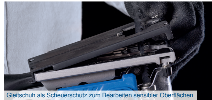
Gleitschuh als Scheuerschutz zum Bearbeiten sensibler Oberflächen.