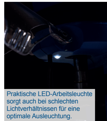
Praktische LED-Arbeitsleuchte sorgt auch bei schlechten Lichtverhältnissen für eine optimale Ausleuchtung.