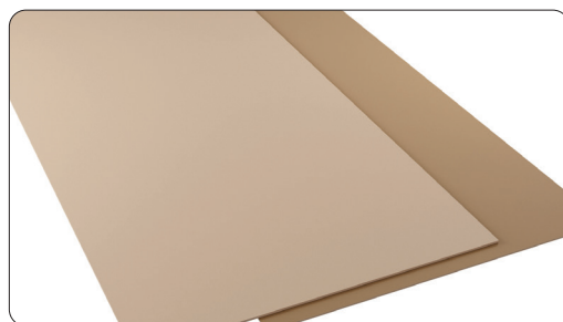
LÁMINA DE PROTECCIÓN SUPERIOR

Sistema de protección para instalar bajo suelos con grosor superior a 10 mm (parquet y suelos laminados).