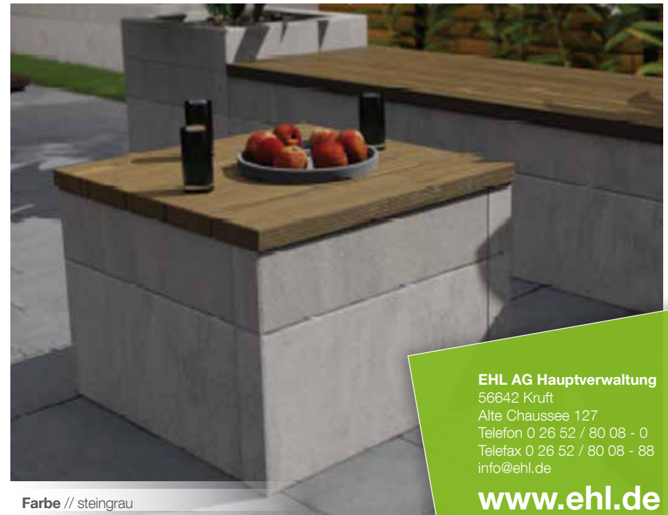
Farbe // steingrau

EHL AG Hauptverwaltung 56642 Kruft Alte Chaussee 127 Telefon 0 26 52 / 80 08 - 0 Telefax 0 26 52 / 80 08 - 88 info@ehl.de