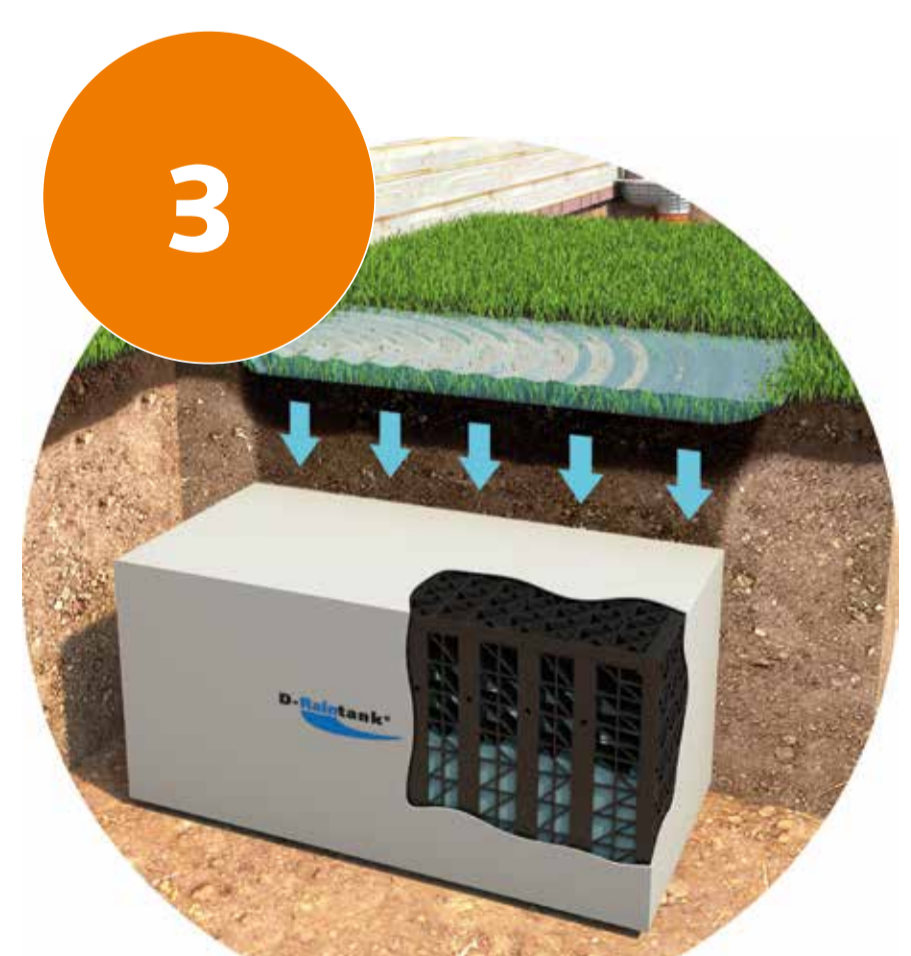
3 Regenwasserversickerung über Dachrinnenabfluss