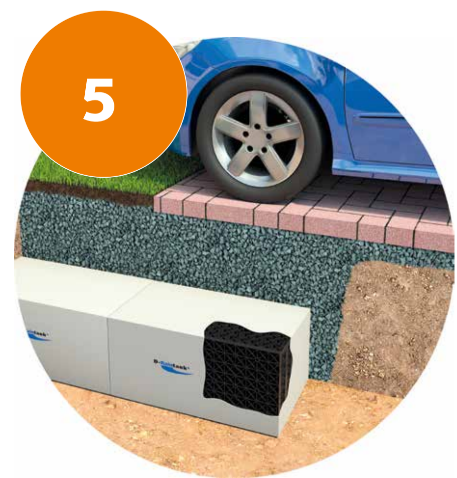
5 Entwässerung unter einer Stellfläche

Die clevere, vielseitige Lösung für die kostensparende Regenwasser-Bewirtschaftung auf Ihrem eigenen Grundstück!*