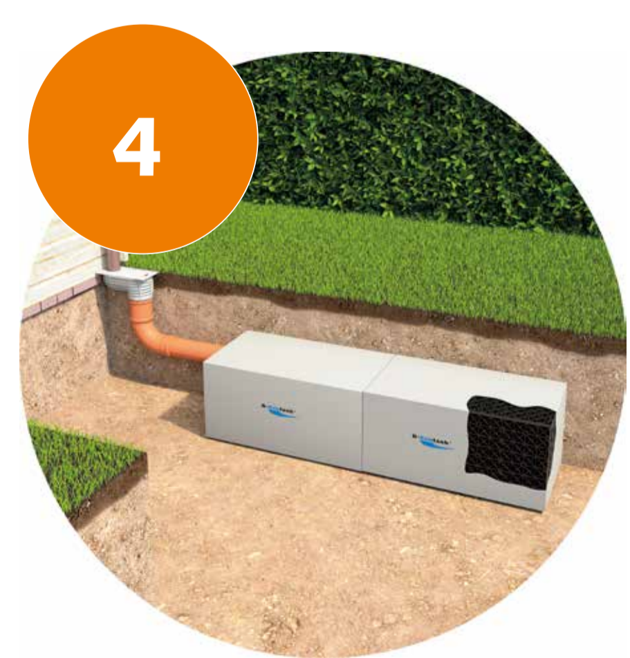
4 Entwässerung über Dachrinne mit Regensinkkasten