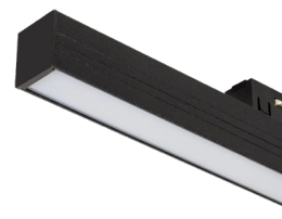
Vista detallada LED