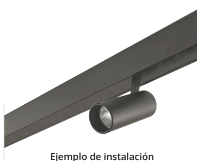
Ejemplo de instalación