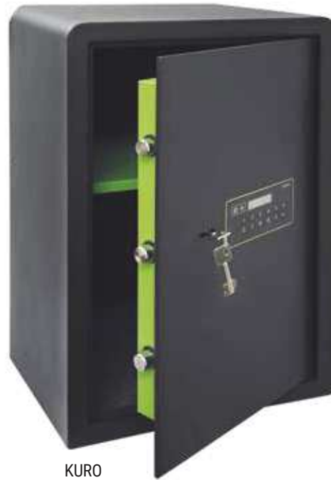
KURO Ref. 630080