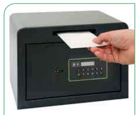
Ref. 630020-SL: con ranura de 150 x 15 mm para introducir billetes o sobres sin abrir la puerta