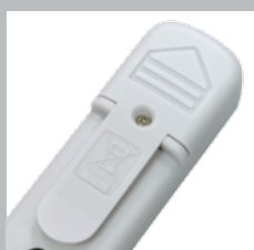
Soporte de clip