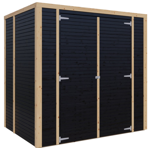
Behandlung: SCHWARZ (RAL 9005)