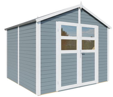
Behandlung: HELLGRAU (RAL 7001)

Nachbehandlungen können mit beliebigen Farbtönen erfolgen.