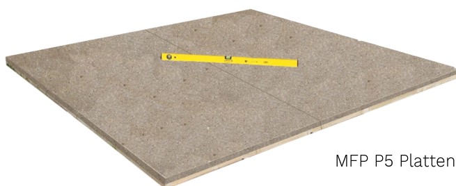
MFP P5 Platten

Fußbodenelemente* von unten behandeln, zusammenlegen, umdrehen und mit einer Wasserwaage ausrichten.