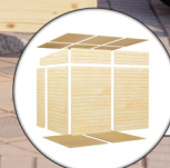
Einfache Elementbauweise Inkl. Fußboden