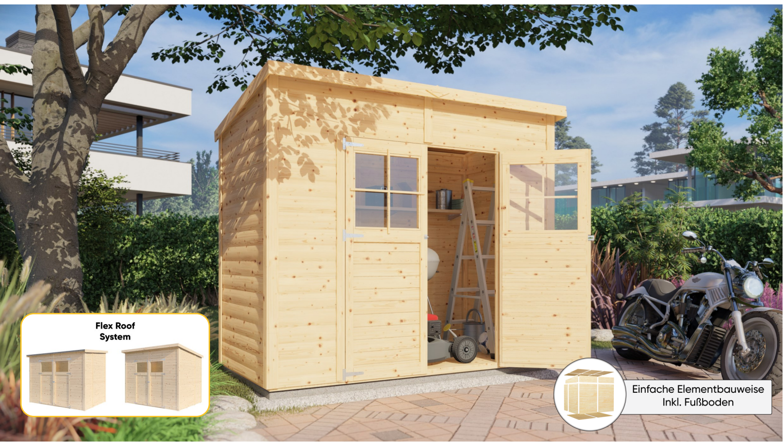
Flex Roof System