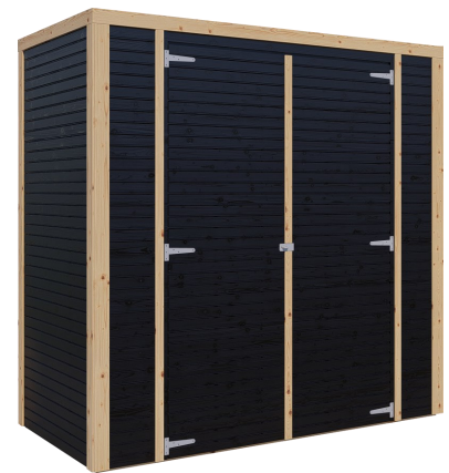
Behandlung: SCHWARZ (RAL 9005)