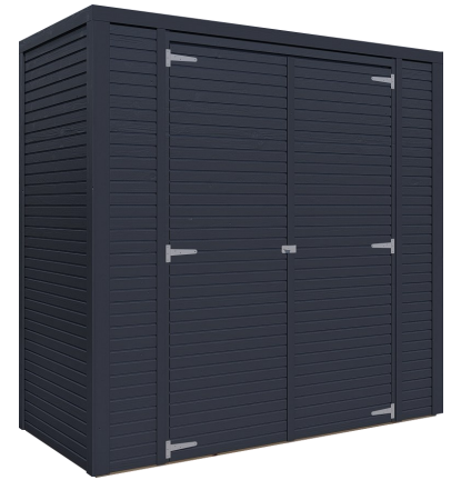
Behandlung: ANTHRAZIT (RAL 7016)

Nachbehandlungen können mit beliebigen Farbtönen erfolgen.