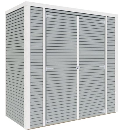
Behandlung: HELLGRAU (RAL 7001)