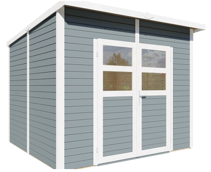
Behandlung: HELLGRAU (RAL 7001)

Nachbehandlungen können mit beliebigen Farbtönen erfolgen.