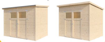
Flex Roof System