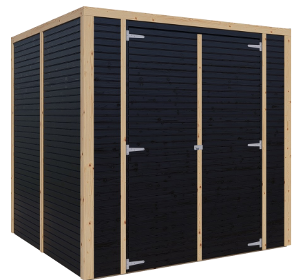
Behandlung: SCHWARZ (RAL 9005)