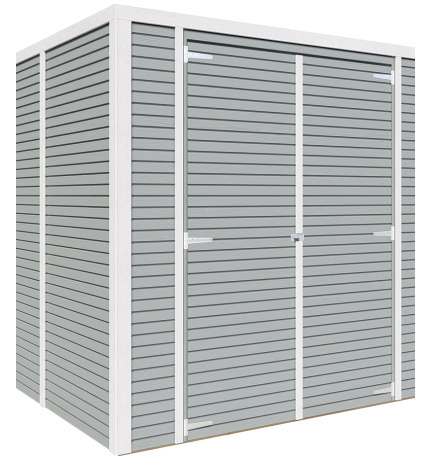
Behandlung: HELLGRAU (RAL 7001)

Nachbehandlungen können mit beliebigen Farbtönen erfolgen.